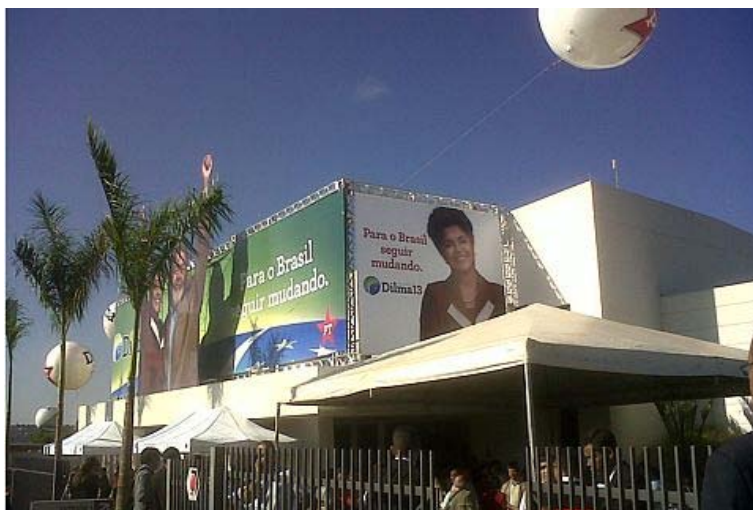
Cerca de 1,5 mil militantes petistas foram ao Unique Palace