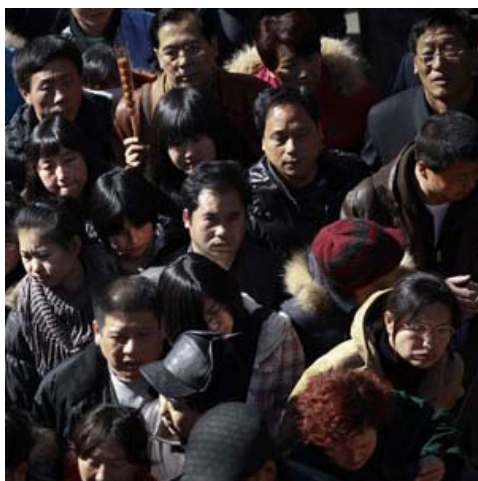
Nos próximos 20 anos, a China sofrerá com a falta de mulheres

A preferência por filhos do sexo masculino na China, Índia e Coreia do Sul combinada ao fácil acesso aos abortos seletivos levará a um desequilíbrio significativo entre o número de homens e mulheres nascidos nesses países. A taxa de nascimentos (SRB, na sigla em inglês, "sex ratio at birth") entre o número de meninos que nascem para cada 100 meninas normalmente é de 105 para 100. Entretanto, com o uso do ultrassom, que torna a seleção "sexual" possível, uma vez que indica o sexo do feto, a taxa de nascimento em algumas cidade da Coreia do Sul chegou a 125 em 1992, e é maior de 130 em diversas províncias da China, de Hena, no norte, a Hainan, no sul.