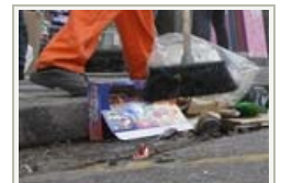
Gari vira celebridade ao se exercitar com vassoura em ruas de Pequim (China)