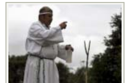
Colombiano faz ritual de exorcismo em La Cumbre