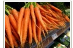
Cenoura substituirá cigarros na Nova Zelândia