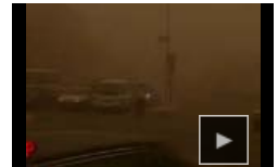
Bagdá fica às escuras em tempestade de areia