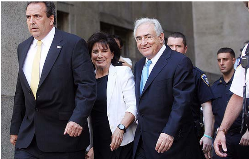
Ex-diretor do FMI Dominique Strauss-Kahn deixa corte de NY ao lado da mulher; ele foi libertado sem fiança

Em carta enviada à Justiça de Nova York, os promotores do caso disseram que a camareira admitiu ter mentido sobre importantes detalhes da sua acusação contra o francês. De acordo com a nova versão, após o incidente ela teria continuado seu trabalho antes de avisar a gerência do hotel sobre a agressão sexual.