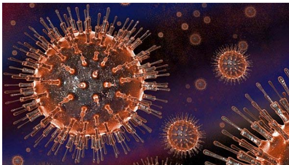
Até 2015 a ONU espera que todos os pacientes elegíveis ao tratamento com antirretrovirais tenham acesso ao medicamento

Relatório aponta queda global no número de novas infecções graças ao maior acesso a drogas antirretrovirais