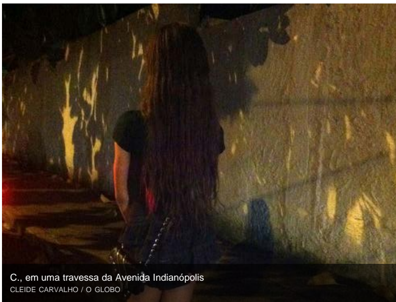
C., em uma travessa da Avenida Indianópolis

SÃO PAULO - Magra, cabelos compridos, short curto. M., 16 anos, abre o sorriso leve e ingênuo dos adolescentes quando perguntada se pode dar entrevista. Poderia ser uma das milhares de meninas que sonham com as passarelas. Mas não é. O relógio marca 1h de sexta-feira. M. é um garoto e está na calçada, numa das travessas da Avenida Indianópolis, conhecido ponto de prostituição de travestis e transexuais, escancarado em meio a casas de alto padrão do Planalto Paulista, na Zona Sul de São Paulo. A poucos passos, mais perto da esquina, está K., também de 16