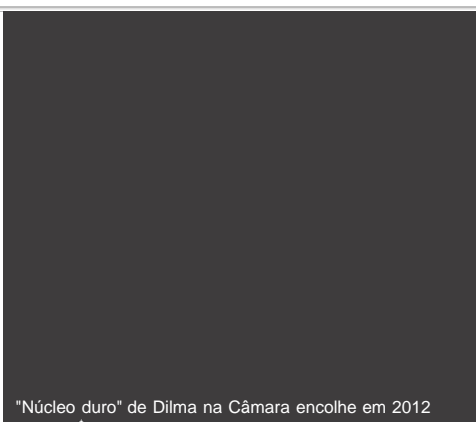
"Núcleo duro" de Dilma na Câmara encolhe em 2012