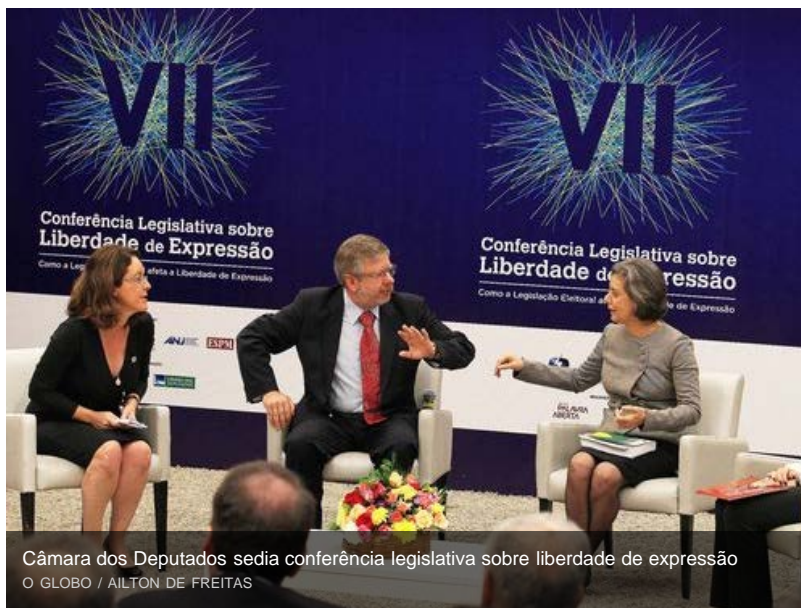
Câmara dos Deputados sedia conferência legislativa sobre liberdade de expressão

BRASÍLIA - Autoridades do Executivo, Legislativo e do Judiciário debateram na manhã desta terça-feira, na Câmara dos Deputados, os efeitos da lei eleitoral na liberdade de expressão e como lidar com redes sociais, como Facebook, Twitter e outras ferramentas da internet. A ministra Helena Chagas, chefe da Secretaria da Comunicação Social da Presidência da República e jornalista, defendeu a liberdade de imprensa e afirmou que as novas mídias mudaram completamente a vida das pessoas e as relações sociais. Para a ministra, as leis ainda não acompanharam a evolução tecnológica da comunicação.