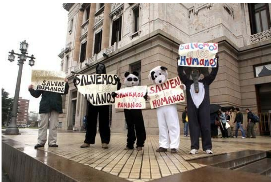
Durante a votação desta quarta-feira, grupos contra o aborto fizeram um protesto em frente ao Senado

O Congresso uruguaio aprovou nesta quarta-feira (17/10) a descriminalização do aborto. A decisão, que já havia passado pela Câmara dos Deputados no mês passado, foi referendada pelo Senado e agora aguarda o parecer do presidente José Mujica.