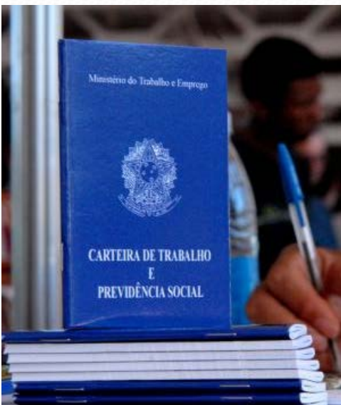
Negros são mais afetados pelo desemprego

Bruno Bocchini - Agência Brasil ( http://agenciabrasil.ebc.com.br/noticia/2012-11-19/apesar-de-maioria-da-populacao-economicamente-ativa-negros-sao-os-que-mais-sofrem-com-desemprego ) 19.11.2012 - 18h59 | Atualizado em 20.11.2012 - 09h59