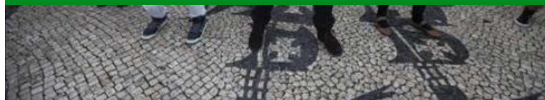
Mulheres dançam em Lisboa como parte da campanha global "One billion rising", convocada pelo grupo V-Day. EFE

EFE: Provedores de conteúdo. Entre em contato com a EFE.