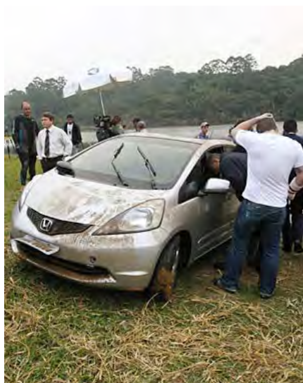
Carro de Mércia é retirado da represa em Nazaré Paulista (SP)

A desembargadora Angélica de Almeida, da 12ª Câmara Criminal do TJ, nega habeas