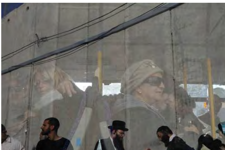
Mulheres ultraortodoxas são vistas num ônibus, enquanto os homens aparecem refletidos, do lado de fora

O GLOBO (FACEBOOK · TWITTER) COM AGÊNCIAS INTERNACIONAIS (FACEBOOK · TWITTER) Publicado: 9/05/13 - 22h22 Atualizado: 9/05/13 - 22h28