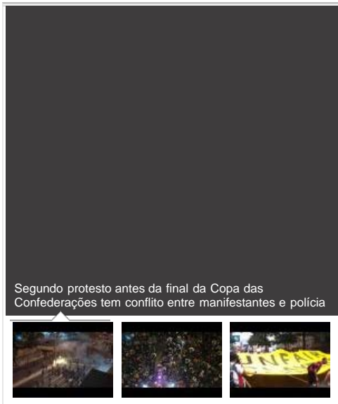
Segundo protesto antes da final da Copa das Confederações tem conflito entre manifestantes e polícia