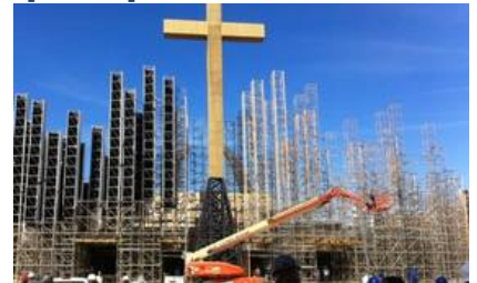
Terreno em Guaratiba terá palco para 750 pessoas e 33 telões de LED