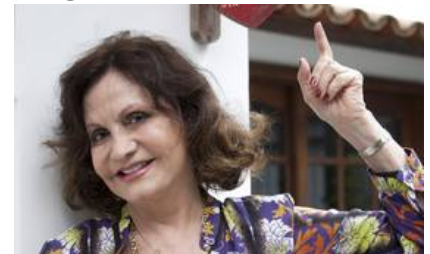
Moradoras da Zona Sul garantem, em suas casas, a estada de turistas que vêm para o Rio participar da Jornada Mundial da Juventude (JMJ)