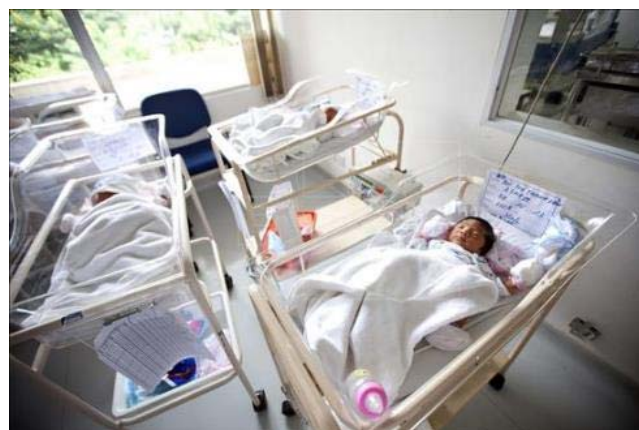
Foram evitados até 850 mil novos casos de infecções do vírus HIV entre crianças (0 -14 anos) desde 2005 nos países mais pobres.

Em 2012, 62% das mulheres grávidas infectadas com o vírus nos 22 países do Plano Mundial Contra a Aids receberam tratamento antirretroviral para evitar a transmissão para seus filhos, segundo o relatório "A infância e a aids: inventário da situação em 2013", publicado nesta quinta-feira em conjunto pelas agências Unaid e Unicef, por ocasião do Dia Mundial contra a Aids no próximo dia 1º de dezembro.