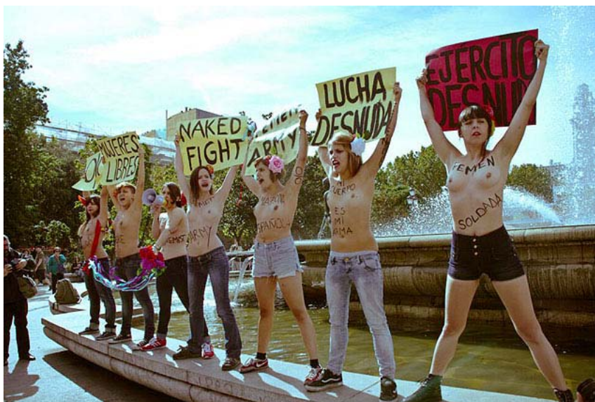
Protesto do Femen na Espanha; cartazes dizem "mulheres livres", "luta nua", "exército do Femen" e "exército nu"

Além da repórter (que se identificou como tal), havia outras cinco alunas no programa, que é gratuito. O curso segue à risca o manual internacional do Femen, grupo fundado na Ucrânia há cinco anos para protestar contra a opressão às mulheres no país.