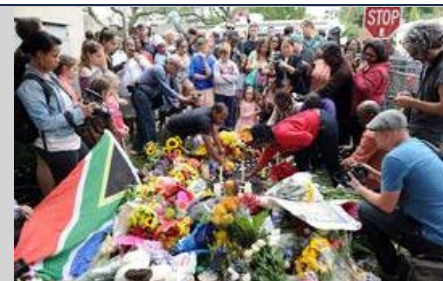
Funeral deve durar de 10 a 12 dias