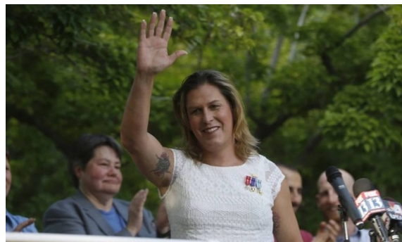
Kristin Beck, transgênera e ex-oficial das operações especiais da Marinha, é candidata ao Congresso americano

24/06/2015 7:00 / ATUALIZADO 24/06/2015 8:09