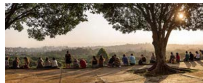
MIRANTES DE SÃO PAULO EM 360° Confira SP por vários ângulos

Não tenho dúvidas. Mas a outra pergunta é: todos os casos investigados de microcefalia no Brasil são causados pelo vírus zika? Provavelmente não, pois há outras causas: toxoplasmose, citomegalovírus, sífilis. Mas esse aumento intenso foi pelo zika.