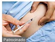
Médicos Americanos Revertem Diabetes em 21 Dias