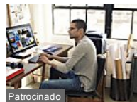
Os sistemas mais gerenciáveis do mundo