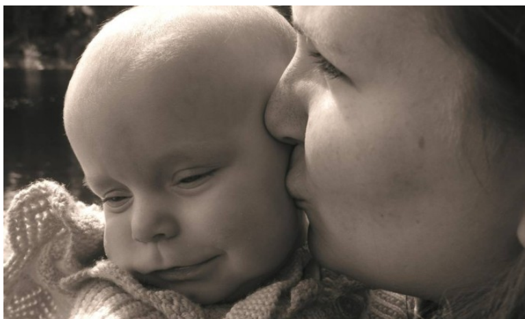
STF: licença igual para todas as mães

BRASÍLIA – O Supremo Tribunal Federal (STF) equiparou nesta quinta-feira a licença remunerada para a mãe que adota uma criança à licença da mãe biológica. No serviço público, a licença da mãe adotante era de até 135 dias; enquanto a mãe biológica tinha direito a 180 dias fora do trabalho. Agora, todas terão direito aos 180 dias, qualquer que seja a idade da criança adotada. A situação do setor privado permanece a mesma, em que mães biológicas e adotantes têm direito a 120 dias de licença remunerada, prorrogáveis por mais 60 dias. Essa prorrogação depende da adesão da empresa a um programa de incentivos fiscais.