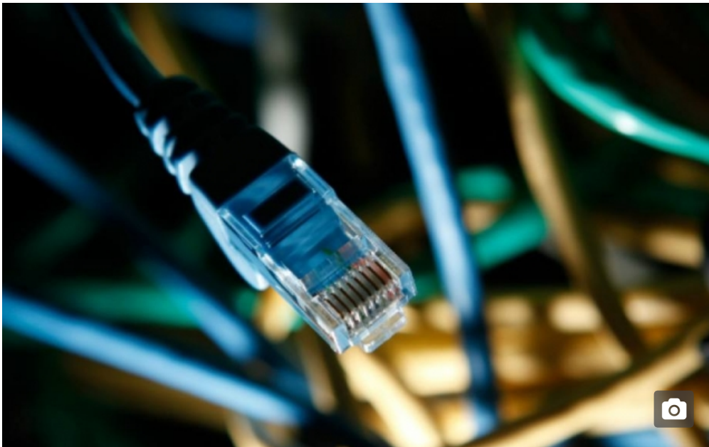
Banda Larga Fixa

■ Por Claudia Tozetto - O Estado de S. Paulo