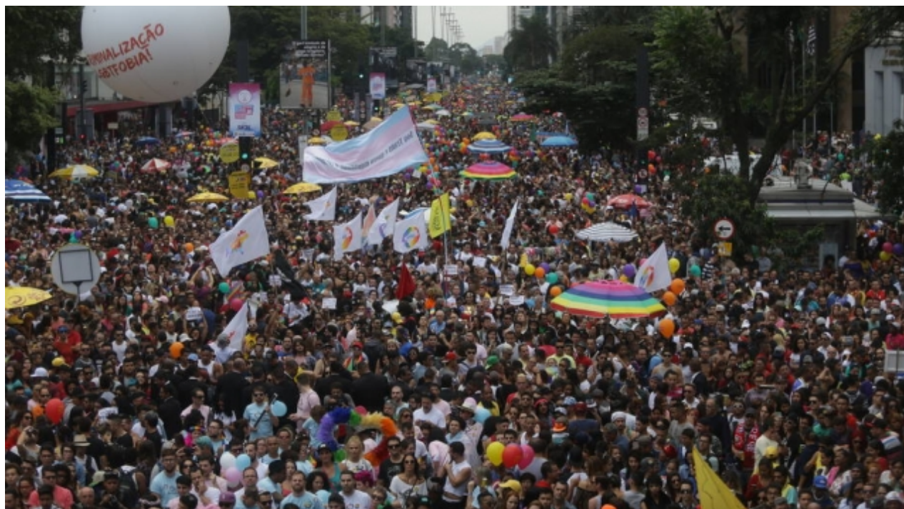
Público protesta contra a homofobia na 20ª edição da Parada do Orgulho LGBT de São Paulo