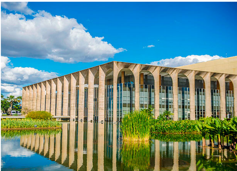
Palácio do Itamaraty, em Brasília; comissão exclui 47 candidatos autodeclarados negros de concurso

O grupo de pessoas negras —53,6% da população, de acordo com a Pnad (Pesquisa Nacional por Amostra de Domicílios) de 2014— é composto por