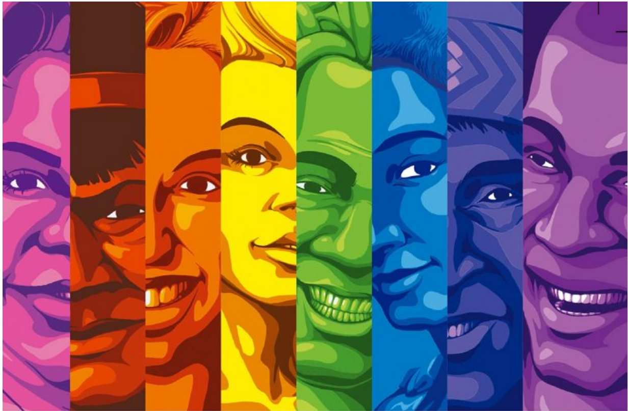
Capa do Manual de Comunicação LGBTI+.