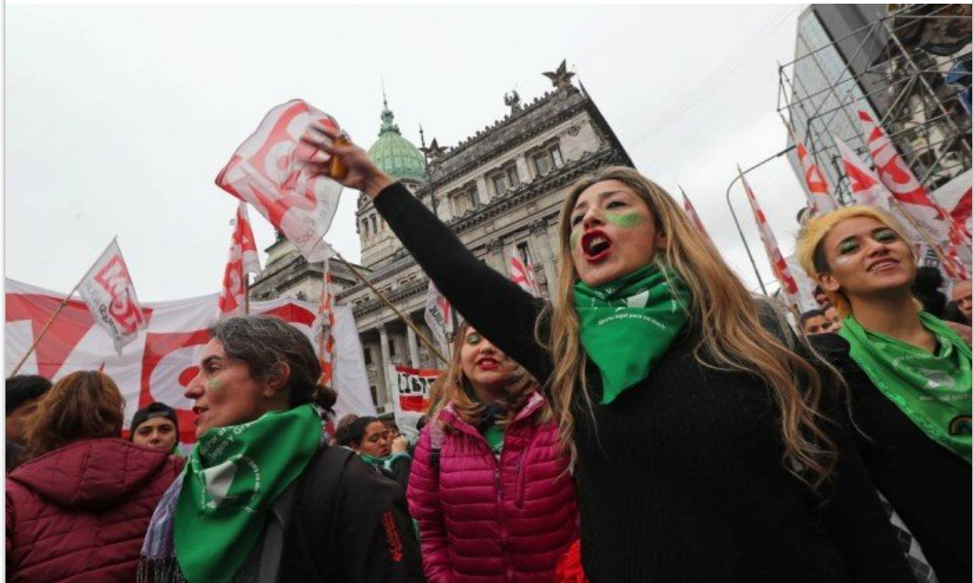
Ativistas contra e favor do aborto legal fizeram manifestações nesta quarta-feira em Buenos Aires