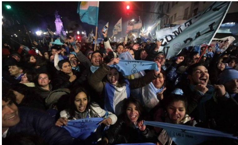
Manifestantes contra a legalização do aborto comemoram a rejeição da interrupção da gravidez pelo Senado argentino

09/08/2018 3:13 / atualizado 09/08/2018 9:15