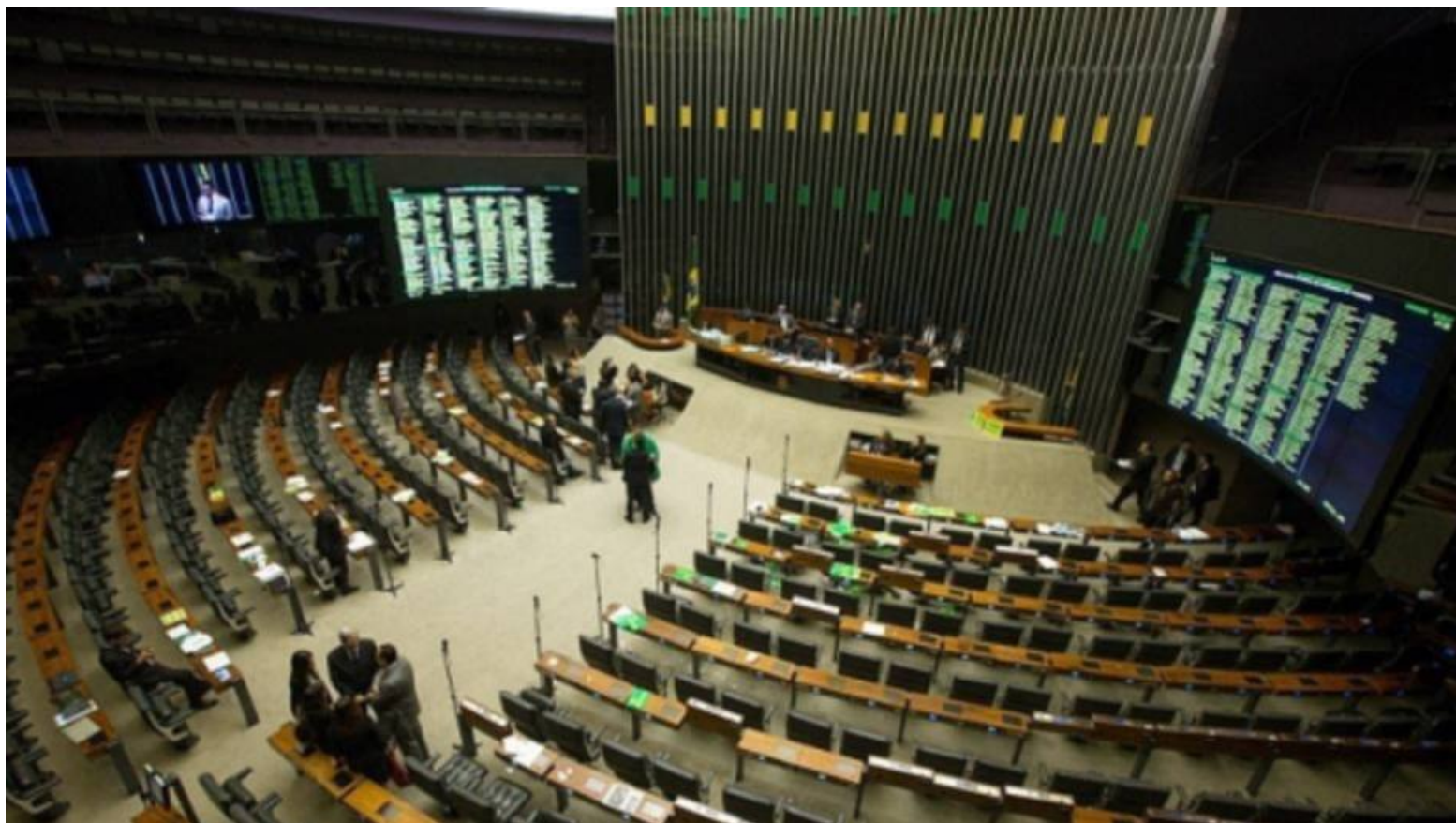
O plenário da Câmara dos Deputados

BRASÍLIA - A Câmara aprovou nesta segunda-feira, 25, pedido da deputada Flávia Arruda (PR-DF) para a criação de uma Comissão Temporária Externa destinada ao acompanhamento dos casos de violência doméstica contra a mulher e feminicídio no País.