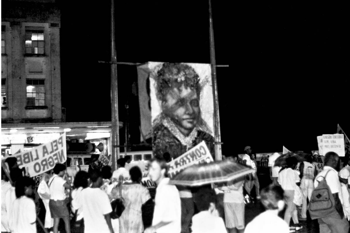
Ato do movimento negro em 1988, na Bahia - Lázaro Roberto/Zumvi Arquivo Fotográfico

A consciência negra é tomar consciência de quem nós somos, de nossa história, de nosso espaço, do que significou a travessia transatlântica e o impacto dela.